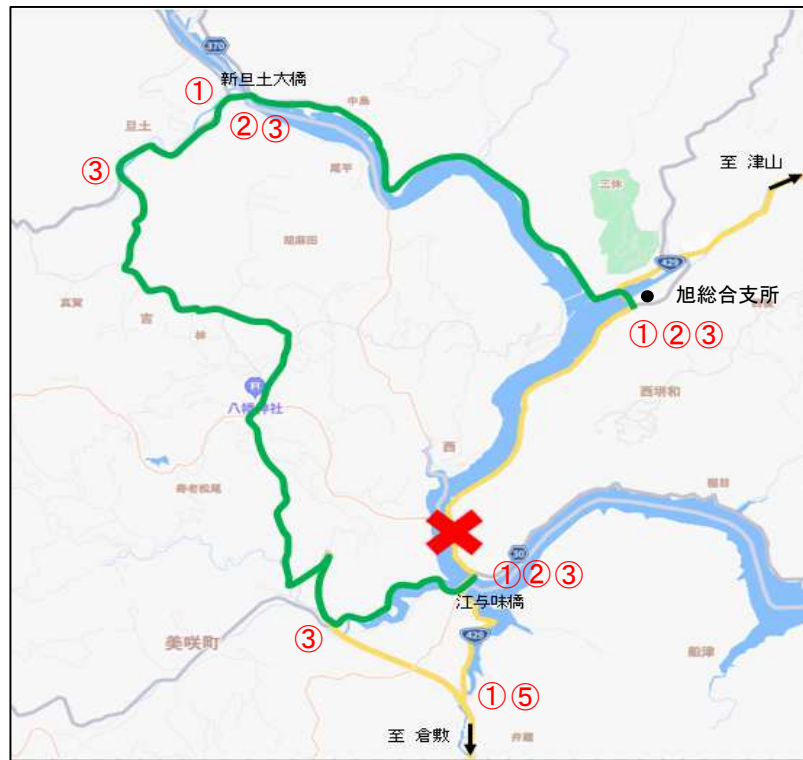
交通規制図・迂回路図