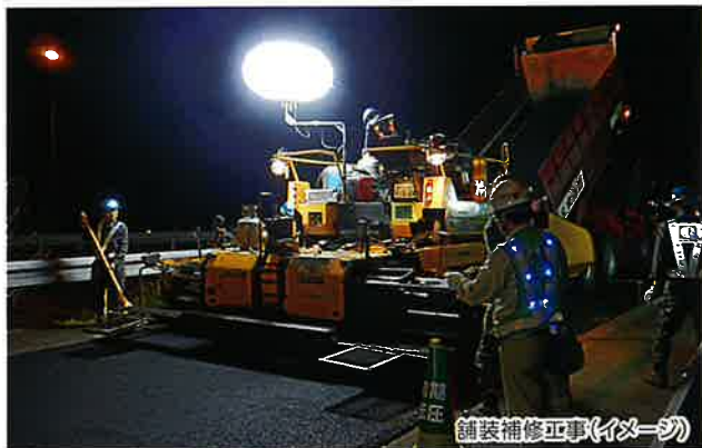
舗装補修工事(イメージ)

※通行止めの時間帯は、区間内のSA・PAがご利用できません のでご注意ください。