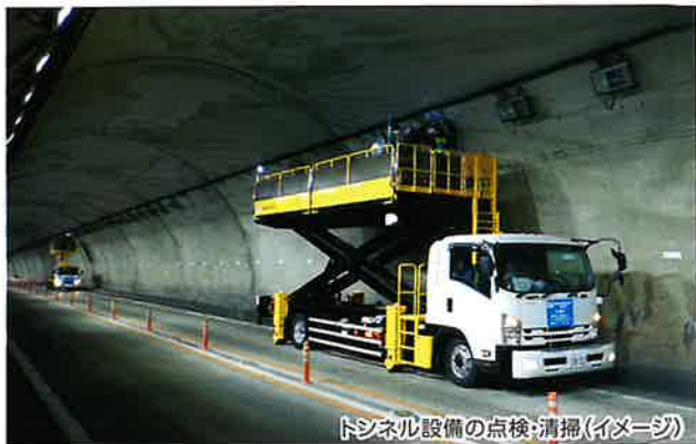
トンネル設備の点検・清掃(イメージ)

お客さまに高速道路を安全で快適にご利用いただけるよう、 E27 舞鶴若狭自動車道、 E9 京都縦貫自動車道および E9 山陰近畿自動車道で通行止めを実施し、トンネル 設備の点検・清掃・舗装補修工事などをおこないます。