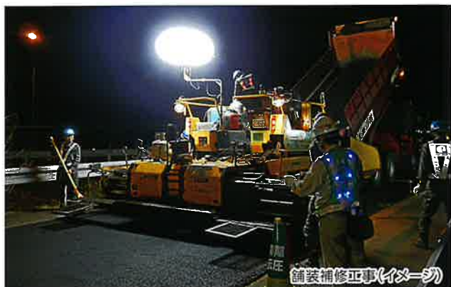
舗装補修工事(イメージ)

※通行止めの時間帯は、区間内のSA・PAがご利用できません のでご注意ください。