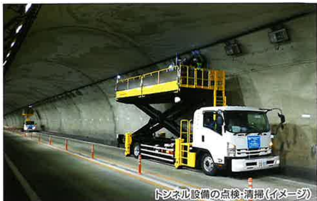
トンネル設備の点検・清掃(イメージ)

お客さまに高速道路を安全で快適にご利用いただけるよう、 E27 舞鶴若狭自動車道、 E9 京都縦貫自動車道および E9 山陰近畿自動車道で通行止めを実施し、トンネル 設備の点検・清掃・舗装補修工事などをおこないます。