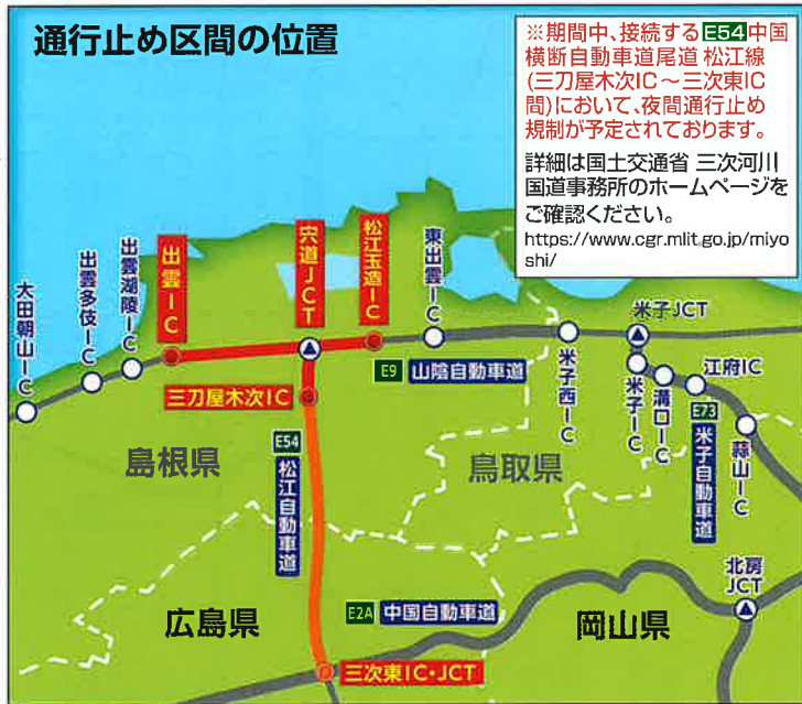
通行止め区間の位置