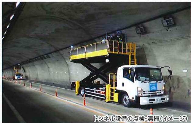
トンネル設備の点検・清掃(イメージ)

お客さまに道路を安全で快適にご利用いただけるよう、 E27 舞鶴若狭自動車道、 E9 京都縦貫自動車道および E9 山陰近畿自動車道で夜間通行止めを実施し、 トンネル設備の点検・清掃・舗装補修工事などを行います。