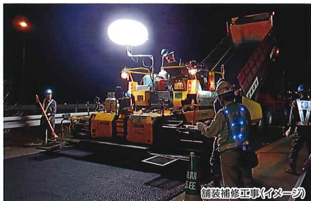
舗装補修工事(イメージ)

※通行止めの時間帯は、区間内のSA・PAがご利用できません のでご注意ください。