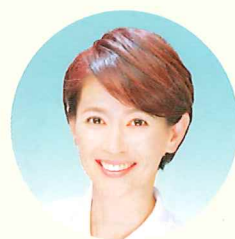
スペシャルアンバサダー 有森 裕子 さん (岡山県出身)