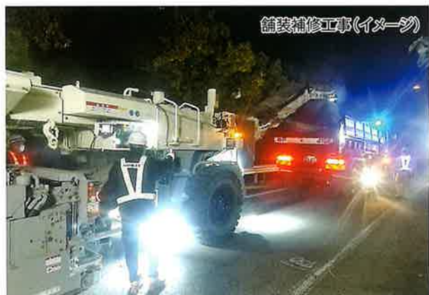
舗装補修工事(イメージ)

E2A 中国自動車道 西宮北ICは、舗装が経年劣化しています。そのため、お客さまに安全で快適にご利用いただけるよう、夜間一部閉鎖を実施し、工事を行います。ご不便とご迷惑をおかけいたしますが、何卒ご理解とご協力をお願いします。