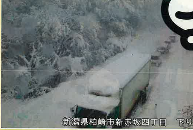
新潟県柏崎市新赤坂四丁目 下り