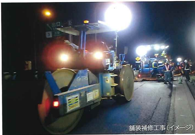
舗装補修工事(イメージ)

工事実施期間中はご不便とご迷惑をおかけいたしますが、何卒、ご理解とご協力をお願いいたします。