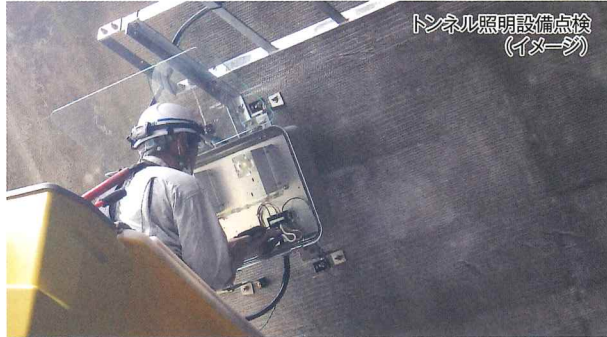
トンネル照明設備点検 (イメージ)