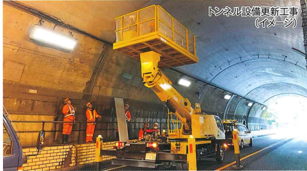
トンネル設備更新工事 (イメージ)

お客さまに高速道路を安全で快適にご利用いただけるよう、 E29 播磨自動車道 「播磨JCT～宍粟JCT間」において、トンネル設備更新工事や伐採・清掃等の維持修繕工事及び構造物点検を行います。