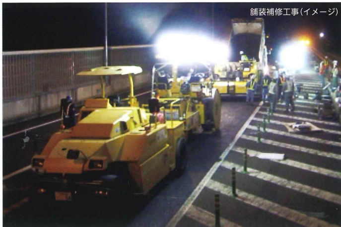
舗装補修工事(イメージ)

工事実施期間中はご不便とご迷惑をおかけいたしますが、何卒ご理解とご協力をお願いいたします。