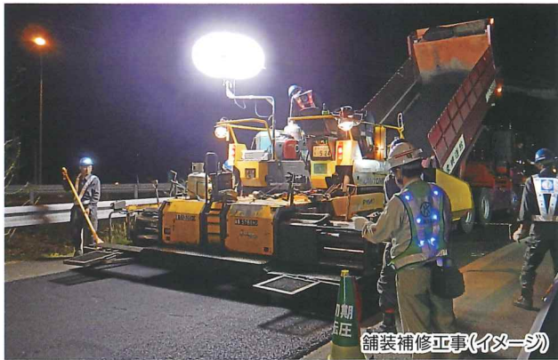
舗装補修工事(イメージ)

※通行止めの時間帯は、区間内のSA・PAがご利用できませんので ご注意ください。(三方五湖PAのみ一般道からご利用いただけます。)