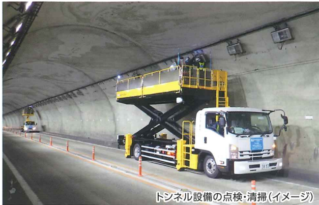
トンネル設備の点検・清掃(イメージ)

お客さまに道路を安全で快適にご利用いただけるよう、 E27 舞鶴若狭自動車道 、 E9 京都縦貫自動車道 および E9 山陰近畿自動車道 で通行止めを実施し、トンネル 設備の点検・清掃・舗装補修工事などをおこないます。