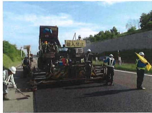
＜ アスファルト舗装作業 ＞