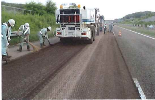
＜ 道路を削る作業 ＞