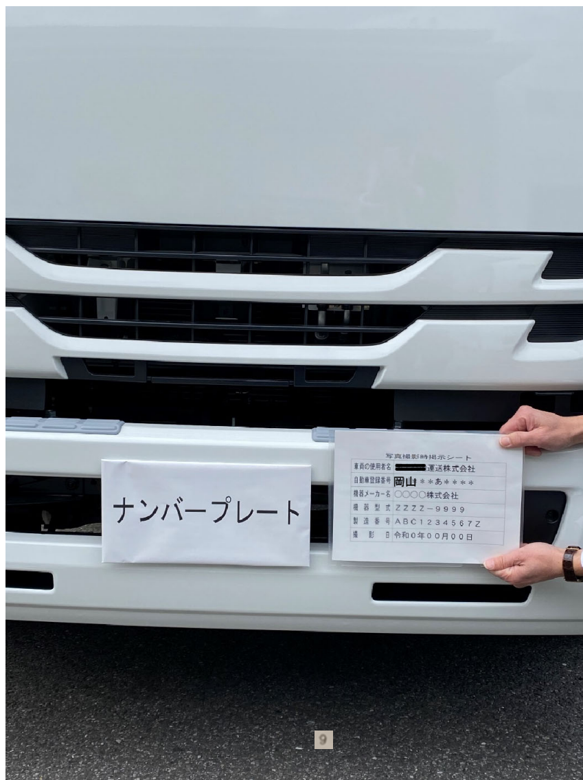
写真② 自動車登録番号（ナンバープレート）と写真撮影時掲示シート（事例）

●ナンバープレートと写真撮影時掲示シートの内容がハッキリ見えるように撮影してください。