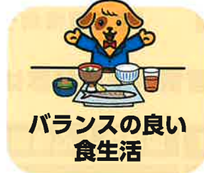
バランスの良い 食生活