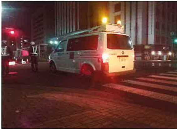
＜舗装体構造調査作業＞