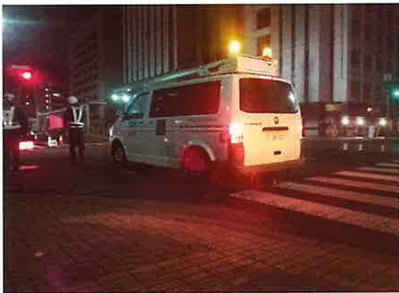
＜舗装体構造調査作業＞