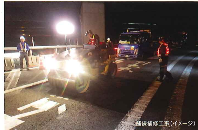
舗装補修工事(イメージ)

工事実施期間中はご不便とご迷惑をおかけいたしますが、何卒ご理解とご協力をお願いいたします。