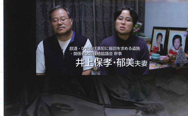
飲酒・ひき逃げ事犯に厳罰を求める遺族 ・関係者全国連絡協議会 幹事