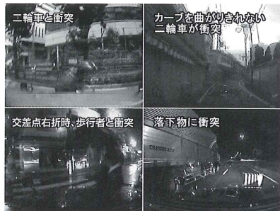
ドライブレコーダーの映像より