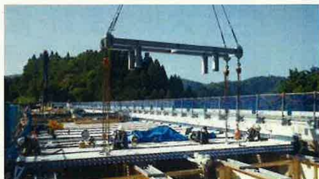
プレストレストコンクリート床版架設

損傷した鉄筋コンクリート床版を、より耐久性の高い床版に取り替えます。 (プレストレストコンクリート床版)