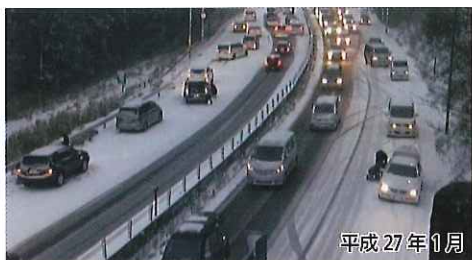
名阪国道 南在家IC付近