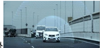
高速道路における自動運転(イメージ)