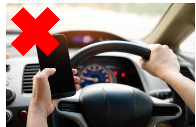
運転中の携帯電話使用等の禁止