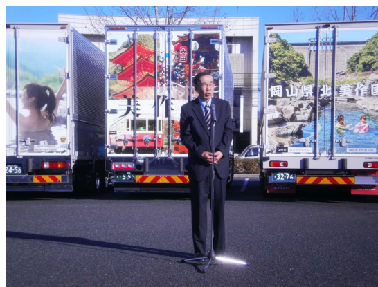
// 中岡海城雄美作地域協議会長